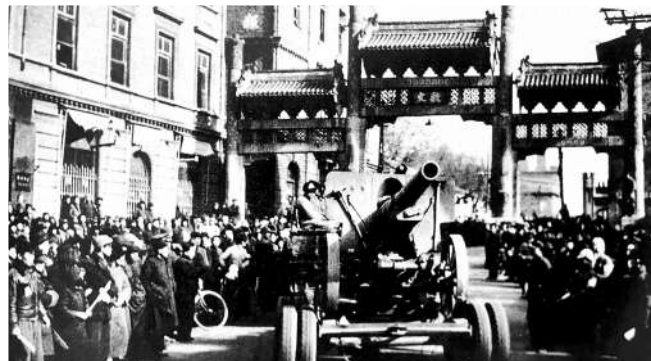
解放军炮兵部队通过东交民巷。