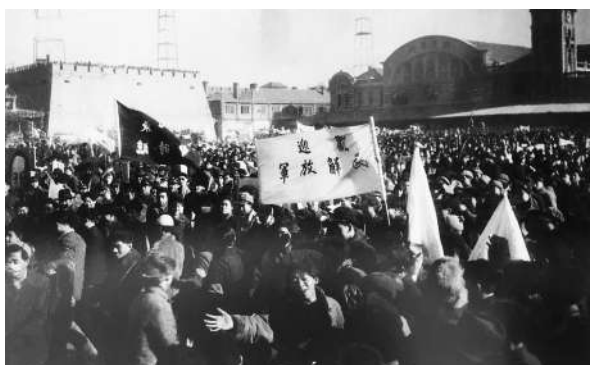
北平市民热烈欢迎解放军入城。

北平的和平解放和城市交接,被历史选择在中国农历新年前后,仿佛是在用中国新年,宣告着一个崭新的时代开启。