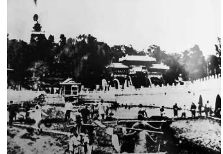
新中国成立前夕，根据政府提出的“服务于人民大众，服务于生产，服务于中央人民政府”的城市建设方针，市民正在踊跃清理北海淤泥。