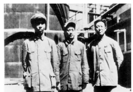
1949年4月10日至5月7日，刘少奇受中共中央和毛泽东主席的委托到天津进行了为期一个月的视察活动。刘少奇阐释了毛泽东提出的“公私兼顾，劳资两利，城乡互助，内外交流”的城市经济政策。图为1949年5月7日刘少奇视察天津永利碱厂。