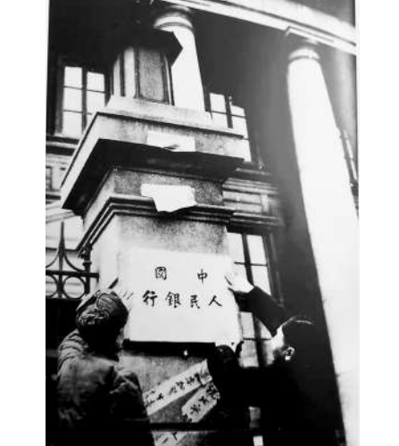
北平和平解放后，北平市军管会接收国民党政府中央银行，挂牌中国人民银行。