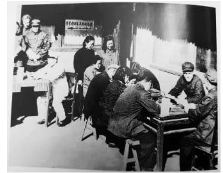
新中国成立前夕，安置失业人员。