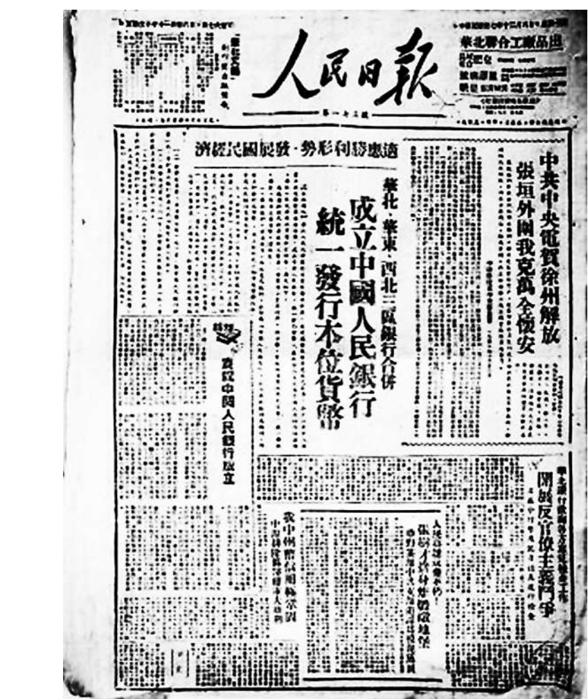
1948年10月，华北财经委员会成立。11月，华北人民政府发布《关于成立中国人民银行发行统一货币的命令》，决定将华北银行、北海银行、西北农民银行合并为中国人民银行。之后，以原华北银行总行的中国人民银行成立，该银行新币成为华北、华东、西北三区的本位货币。图为1948年12月6日的《人民日报》报道华北人民政府成立中国人民银行，统一发行本位货币。

井冈山时期，毛泽东就认为经济问题的解决是红色政权存在的条件之一。赣南闽西时期，他指出：“不进行经济建设，革命战争的物质条件就不能有保障。”抗日战争时期，中国共产党领导的武装力量所以能抗击一半以上的侵华日军和95%的伪军，所以能成为抗战的中流砥柱，重要原因