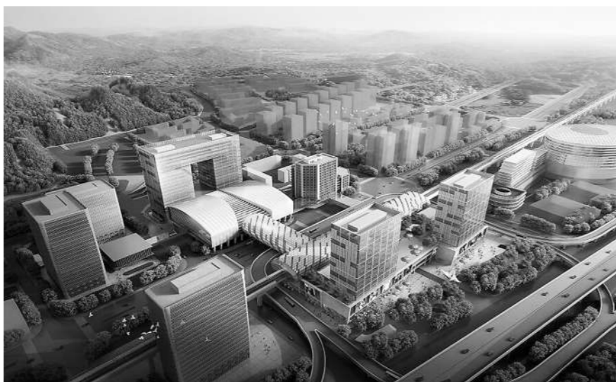
苹果园将成为京西规模最大的交通枢纽(效果图)。

果园站封站后,6号线的换乘厅也将于今年进场施工。此外,现已通车运行的S1线也将继续加快金安桥至苹果园段项目施工,推进区间剩余承台、墩柱及梁板的施工以及高压线改移工程,计划今年