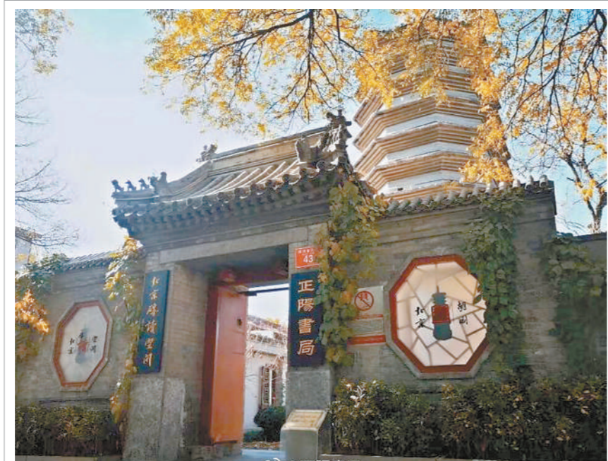
西城区万松老人塔经过活化利用,建成了“砖读空间”。

本报(记者 王海燕)西城区文物腾退工作已接近尾声,记者昨天从西城区人代会上了解到,《西城区关于促进文物建筑合理利用和开放管理的若干意见》已经出台,鼓励社会力量参与到文物建筑活化利用中来。